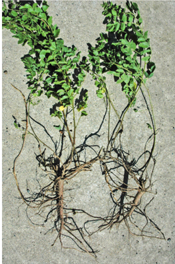
図2 カンゾウ植物を掘り起こしたもの