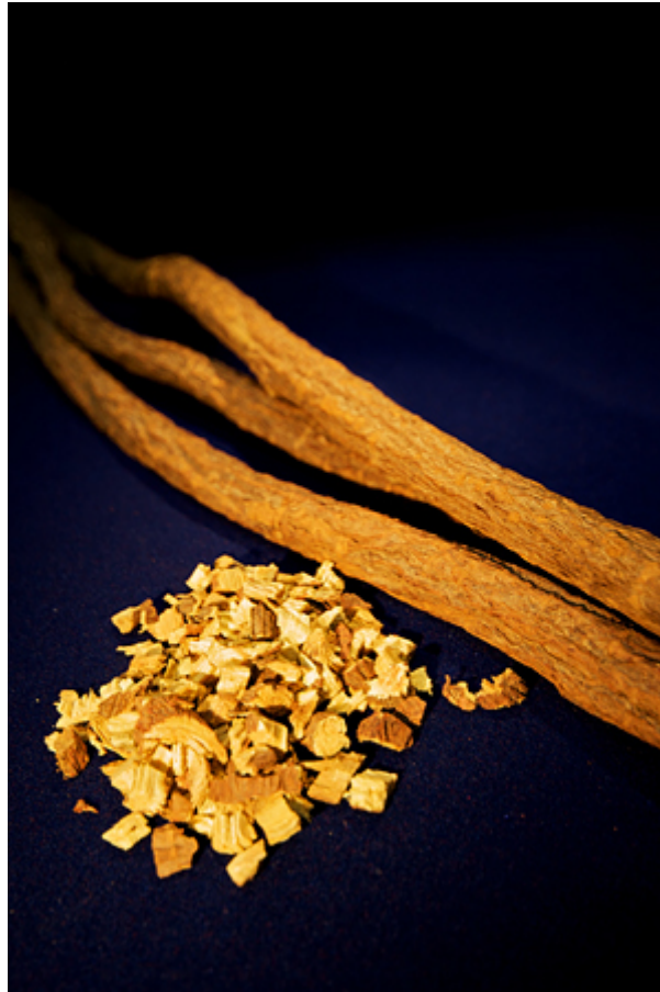
図3 生薬として用いられる甘草根ときざみ（甘草根を刻んだもの）

カンゾウの甘味成分グリチルリチンは砂糖の150～300倍の甘さがある。