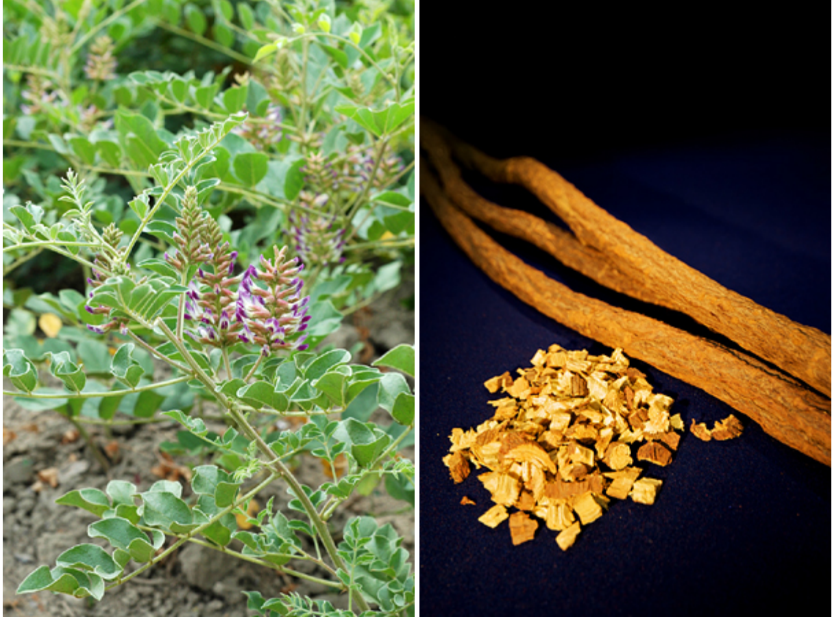
図 カンゾウ植物（左）と生薬として用いられる甘草根ときざみ （甘草根を刻んだもの）（右）