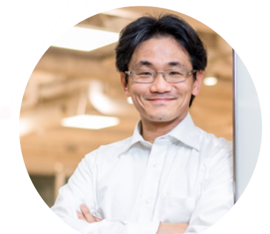
経済経営情報融合分析チーム Business and Economic Information Fusion Analysis Team

As a social infrastructure for the development and operation of artificial intelligence (AI), we are developing and implementing technologies that allow data subjects to safely and fully utilize private data containing personal information and trade secrets. As part of these efforts, we are also exploring document formats that allow easy and accurate composition and comprehension by humans, as well as AI to support creation, comprehension, and advanced use of those documents.