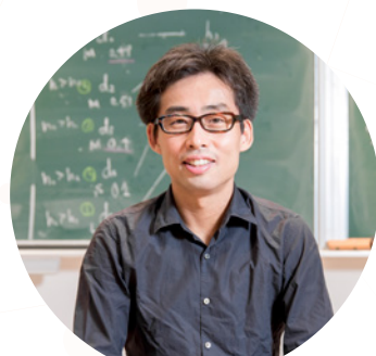
音響情景理解チーム Sound Scene Understanding Team

Our research focuses on the public image of AI/robots in Japan and other East Asian countries. More specific targets are its historical transitions and its representations in fictional materials including sci-fi. Also planned is comparative research of the public images among East Asian, or Buddhist, countries. We are tackling to propose rather unique perspectives on human-AI relation from the East Asian viewpoint. About new technology (mainly artificial intelligence), we try to extract user requirements related to usage from the viewpoint of human and propose social acceptability of new technology.