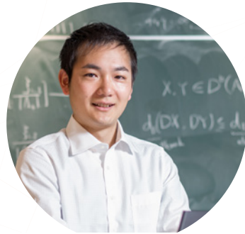
空間情報学チーム Geoinformatics Team

人工知能等が浸透する社会での倫理的・社会的課題等に対応するため、人工知能の進展が人間社会に及ぼす影響の分析と対策を行います。 Analyzing ethical codes and legal systems necessary for the increasing use of AI technology in our daily life and the discussion of these matters.