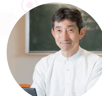
分散型ビッグデータチーム Decentralized Big Data Team