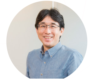
科学技術と社会チーム Science, Technology and Society Team

We will examine AI ethics that will guide the function and deployment of AI. We mainly focus on privacy protection, explainability, accountability, trustworthiness, and AI agents. In addition to researching related AI technologies, we will examine and analyze the current status of legal and social systems, and consider what the future should be like. We have investigated (1) the way how we treat our personal data after our death and (2) what is AI in post-modernism such as actor network theory since FY2021.