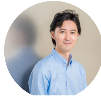
音楽情報知能チーム Music Information Intelligence Team

We aim at developing intelligent systems that understand and assess the state and changes of urban areas and natural environments from large-scale time-series geospatial data. We study fundamental technologies of geospatial data analysis that can deal with data incompleteness, limited training data, and multimodality. Our applied research includes disaster response, urban planning, and forest monitoring.