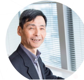
社会における AI 利活用と法制度チーム AI Utilization in Society and Legal System Team

We will develop a computational theory in which media operations are expressed as combinations of lattice operations. We will construct a system that accumulates media operation cases of media design experts and lets novices reuse them to produce content.