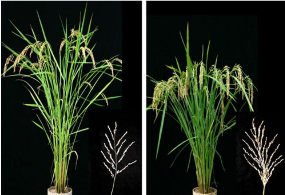
図1 コシヒカリ（左）とハバタキ（右）

サイトカイニンの分解反応を触媒する酵素。側鎖を切断し、アデニンと側鎖由来グテナール化合物を生ずる。シロイヌナズナやイネ、トウモロコシなどでの研究から、CKXは多重遺伝子族を構成しており、各遺伝子で発現場所や発現制御様式が異なることが明らかにされている。イネゲノム上には11種類のCKX遺伝子が見いだされている。サイトカイニンの細胞内のサイトカイニンレベルのフィードバック調節機構の本体になっている。