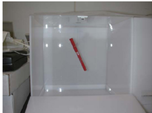
< 尾懸垂試験 >