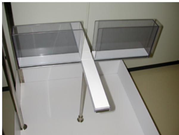
(図) マウスの不安行動を観測する高架式十字迷路

セロトニンは、複数の受容体を介して多くの生命現象をコントロールしています。不安行動を制御する仕組みの一部が明らかになったことにより、不安や情動障害などの薬物治療に対して、より有効性の高い方法を確立できる可能性が期待されます。