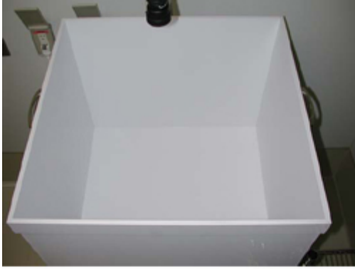
< オープンフィールド解析 >