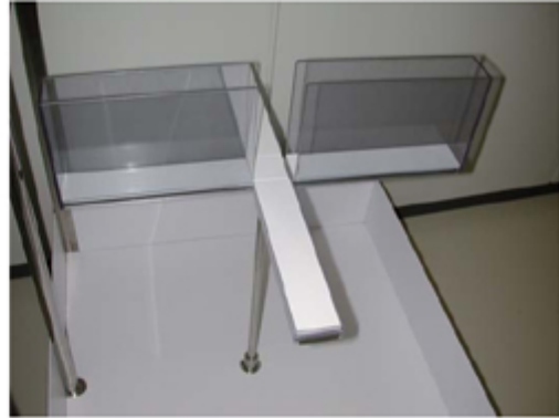
< 高架式十字迷路 >