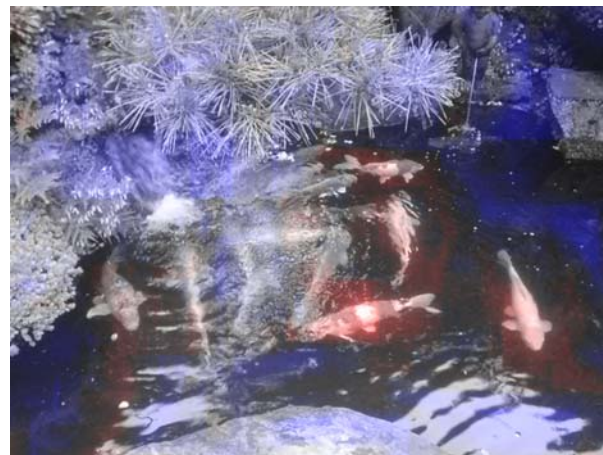
図1. レポート画像例：非注目領域(青)と注目領域(魚, 赤).