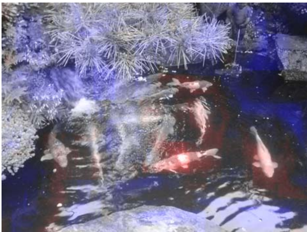
図1. レポート画像例：非注目領域(青)と注目領域(魚, 赤).