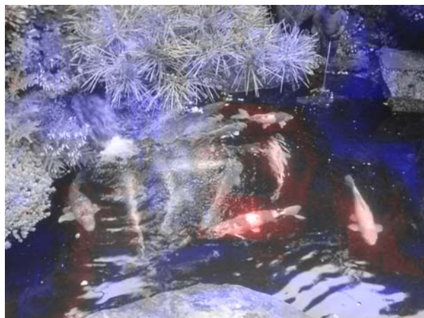
図1. レポート画像例：非注目領域(青)と注目領域(魚，赤)。