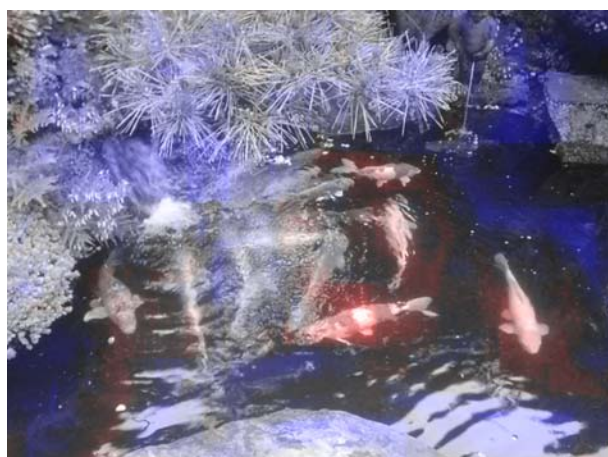
図1. レポート画像例：非注目領域(青)と注目領域(魚，赤)。