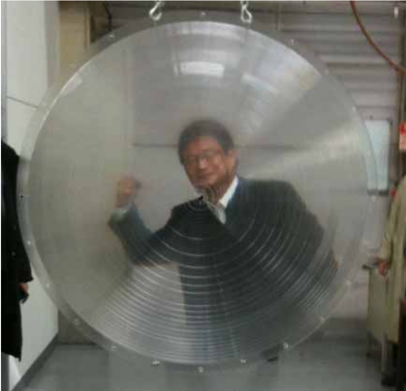
Experimental Fresnel lens with diameter of 1.5m