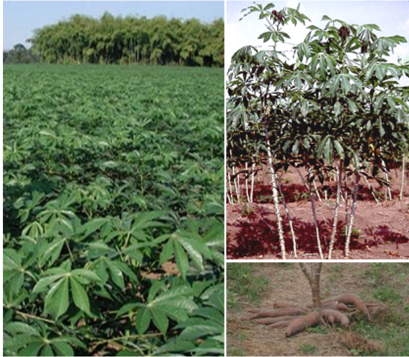
(写真)左：キャッサバ畑。右上：全体像、右下：収穫した芋